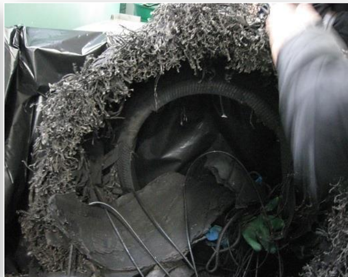
Opona całkowicie zniszczona podczas awaryjnego lądowania samolotu