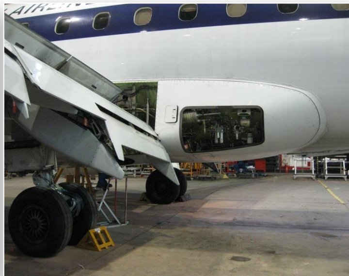
Samolot przewoźnika EuroLOT, przygotowywany do lotu