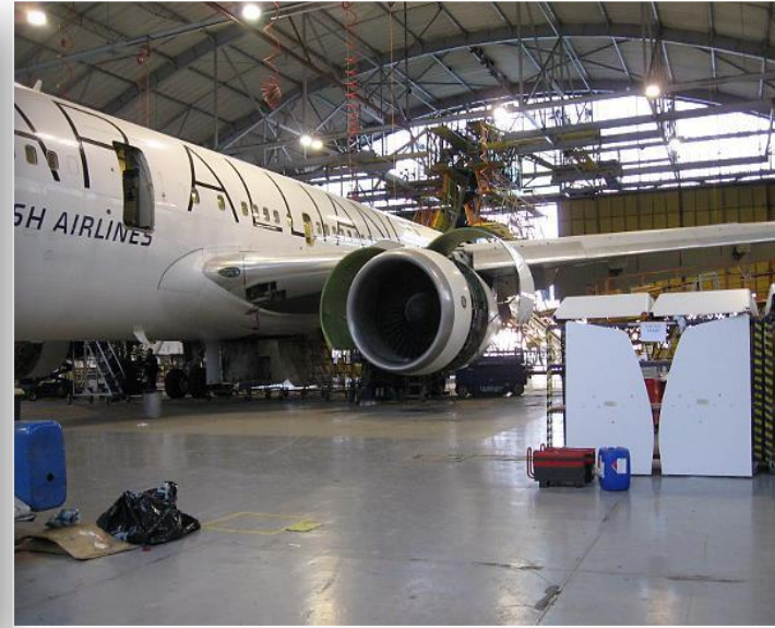
Boeing 767 - samolot dalekiego zasięgu przygotowywany do eksploatacji