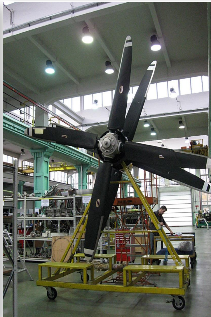
Baza techniczna PLL LOT, miejsce gdzie odbywają się przeglądy techniczne i remonty samolotów polskiego przewoźnika lotniczego PLL LOT