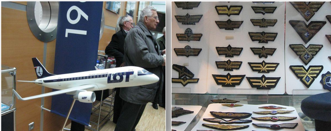
Sala Historyczna w biurowcu Zarządu PLL LOT

Następnie udaliśmy się do Bazy Technicznej PLL LOT. Tam zapoznaliśmy się z pracą personelu technicznego, który wykonuje remonty i przeglądy techniczne samolotów LOT-u. Widzieliśmy wymontowany silnik samolotu i inne części techniczne wymagające naprawy. Pokazano nam również koło samolotu, którego opona uległa niemal całkowitemu zniszczeniu. W hangarze oglądaliśmy samolot Boeing 767, w którym wymontowano wszystkie fotele i inne elementy kabiny pasażerskiej, celem przygotowania nowego wystroju, a także kabinę pilotów (kokpit), natomiast w innym hangarze znacznie mniejszy samolot przewoźnika EuroLOT.