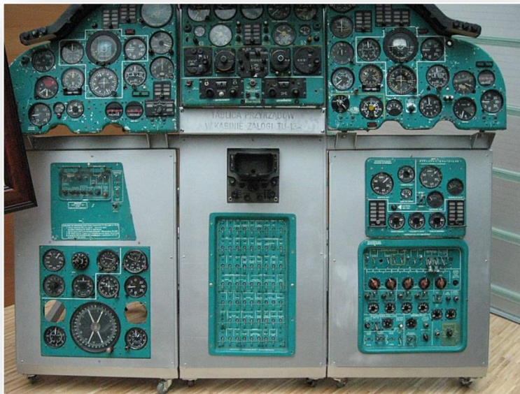
Fragment kabiny pilotów (kokpitu)