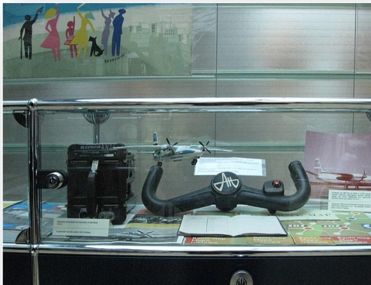
Elementy kabiny pilotów - wolant