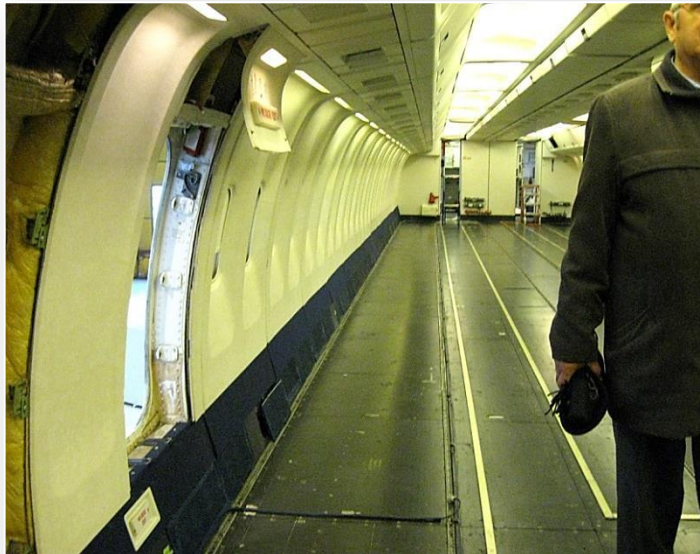
Modernizacja kabiny pasażerskiej