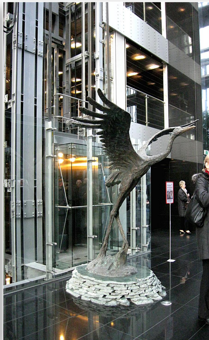
Biurowiec Zarządu PLL LOT - żuraw godło polskiego przewoźnika