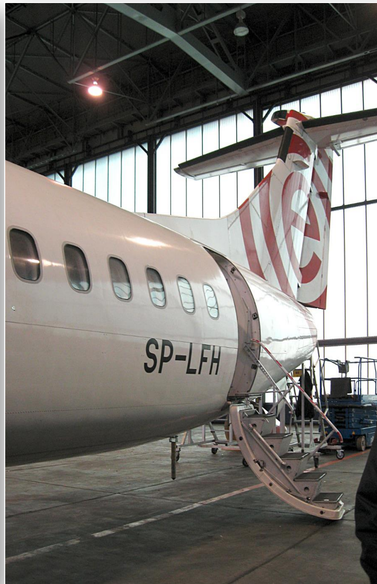
Samoloty przewoźnika lotniczego EuroLOT w hangarze