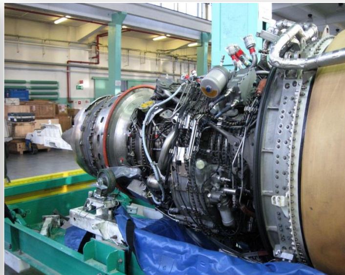
Silnik przygotowany do przeglądu technicznego